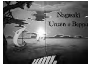
1930年代のインバウンド用パンフレット

国際観光には、 外客を日本に誘致するインバウンド と、 日本の客を外国に送客するアウトバウンド に分かれる。日本では高度経済成長期まで、国際観光とは 欧米 の富裕層を物価の安い日本に滞在させる インバウンド が主だった。日本が本格的にインバウンドに着手したのは世界恐慌後の1930年代だ。中国に住む欧米人のリゾート地として雲仙や霧島、瀬戸内海などを整備する「 国立公園法 」(1934年制定)がそれに関する最初の法律だといえるだろう。しかし40年代になると、戦争で国際観光どころではなくなる。