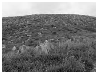
秋吉台のカルスト台地

山口県の北部は 日本海側 の気候で降水量が多く、南部は 瀬戸内海 の気候で冬でも温暖な天気が続く。県の中央に位置する高原地帯は、石灰岩が野原に露出した、 カルスト台地 と、その地下は神秘的な美しさを誇る秋芳洞 あきよしどう で知られており、 秋吉台国定公園 に指定されている。