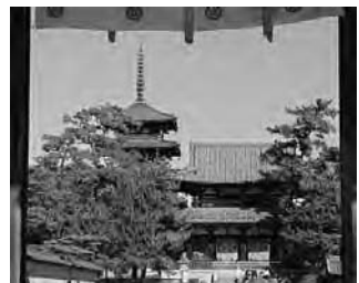
世界遺産 法隆寺

1990年代に入り、日本のバブル経済は崩壊した。すると1991年に日本政府はアウトバウンドとインバウンドのバランスを取るべく、 two-way ツーリズム を提唱した。また、92年に日本はUNESCOの 世界遺産条約 に調印した。このときは文化遺産としては 法隆寺 や 姫路城 、自然遺産としては 屋久島 や 白神山 がUNESCOの諮問機関である ICOMOS （国際記念物遺跡会議）によって認定され、このことはインバウンドにも大きな影響を与えた。