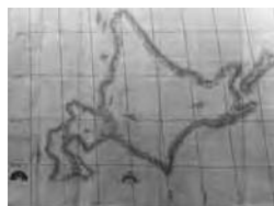
大日本沿海輿地全図