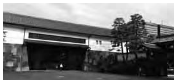
江戸城桜田門（千代田区）

それを、長州藩の松下村塾率いる吉田松陰は批判したが、大老は吉田らを安政の大獄にて処刑した。この大獄に対して尊王攘夷を掲げる水戸藩の浪士たちを中心に江戸城の門外で大老一行を殺害した。これを桜田門外の変と呼ぶ。