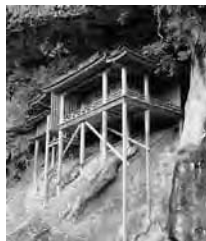
三徳山三仏寺投入堂

鳥取県の東部の海岸に横たわる風紋の美しい 鳥取砂丘 は 山陰海岸国立公園 の目玉である。また地球科学的にみて重要な自然遺産を含む「 山陰海岸世界ジオパーク 」にも指定された。鳥取県中部には ラジウム 含有量が世界有数で、本格的な湯治場として知られている 三朝温泉 があり、そのさらに山奥には、山岳修験道の聖地として岩肌に建てられた寺院建築が知られる 三徳山三仏寺投入堂 がある。一方鳥取県西部にみえる富士山型の山が中国山地最高峰の 大山 である。またの名を鳥取県西部の旧国名をとって「 伯耆富士 」と呼ばれており、その南に連なるジャージー牛の飼育で有名な高原地帯の火山、 ひるぜん 蒜山 とともに、 大山隠岐国立公園 を形成している。